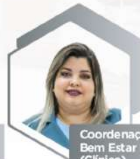
Coordenação de Bem Estar Estudantil (Clínico)