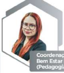
Coordenação de Bem Estar Estudantil (Pedagogia)