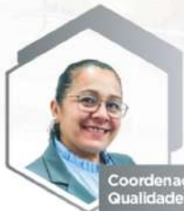
Coordenação de Qualidade