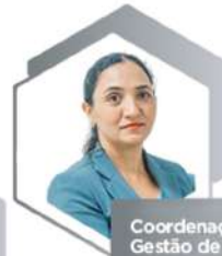
Coordenação de Gestão de Pessoas