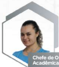
Chefe de Operações Acadêmicas