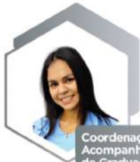
Coordenação de Extensão Acompanhamento de Graduados